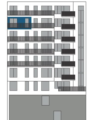
Pohled SV / NE view