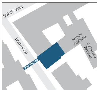
Situční schéma / site layout